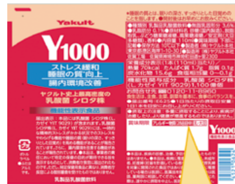
アレルギーマ物質(28品目中)の表示例