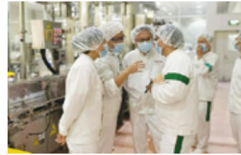
食品安全自主検査の様子

中国ヤクルトグループの3工場(上海、天津、無錫)では、「安全・安心」でおいしい製品を消費者に提供するため、食品安全法の規定に基づき、食品安全自主検査として工場での実地検査とオンラインでの検査を毎年1回ずつ実施しています。